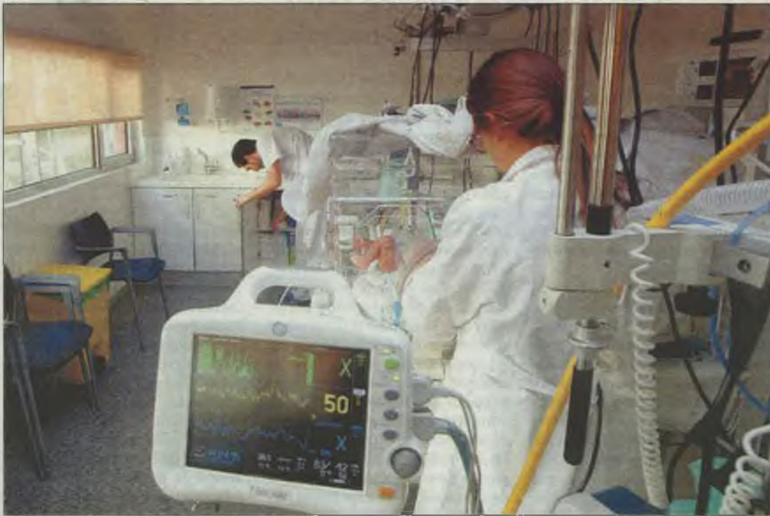
Profesionales del Servicio de Pediatría de un hospital de la región.