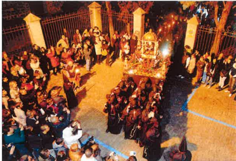
La imagen del Cristo de las Batallas saliendo de Mosén Rubí no se verá este año.

A pesar de ello los cambios en el recorrido serán mínimos, aunque se partirá de la Catedral para pasar después por Tomás Luis de Victoria, Zurraquín, Marqués de Benavites, Mosén Rubí, Bracamonte, Fuente el Sol, arco del Mariscal, la Ronda Vieja, San Vicente, San Segundo y vuelta a la Catedral. Será por tanto con este recorri-