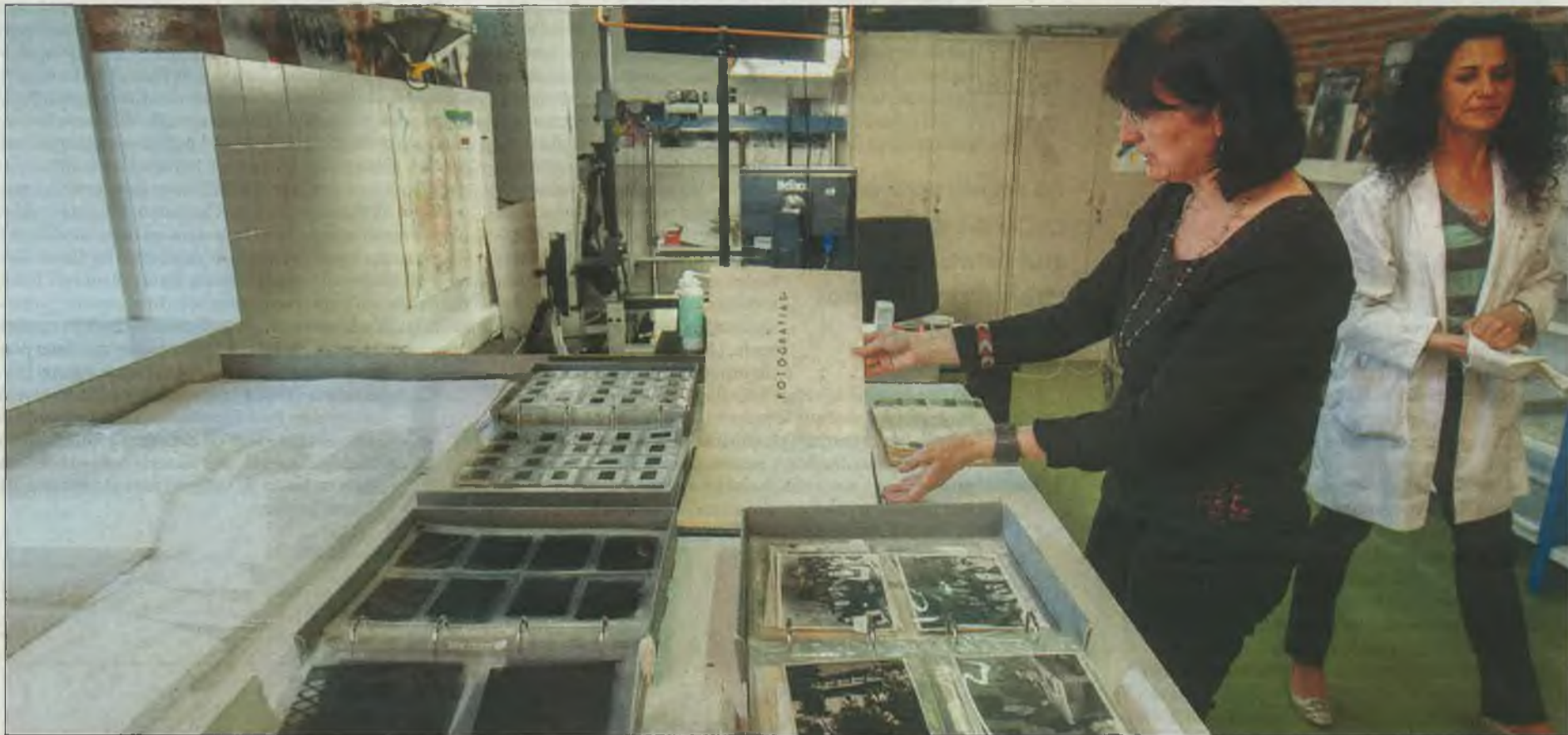
Sala en la que se trabaja con documentos gráficos, entre ellos las fotografías. / ANTONIO BAROLOMÉ