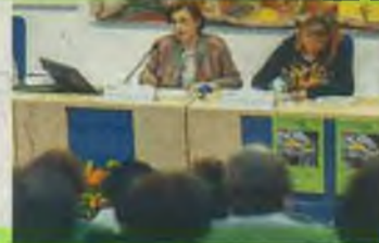
La catedrática, en un momento de su ponencia.