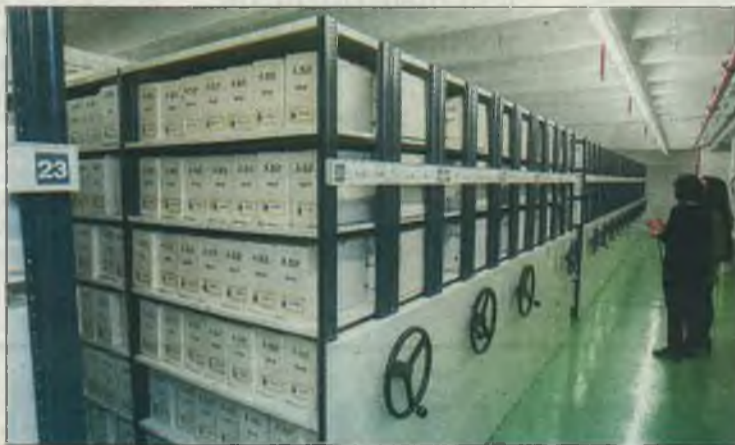
Uno de los depósitos del Archivo.