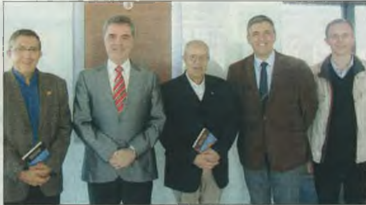
Representantes de ambas instituciones tras la firma del convenio.

La línea preferente de actuación del trabajo en común será la exposición de los contenidos espirituales donde coincidan el Budismo y el Cristianismo, estando la cátedra abierta a otras religiones, así como la investigación y