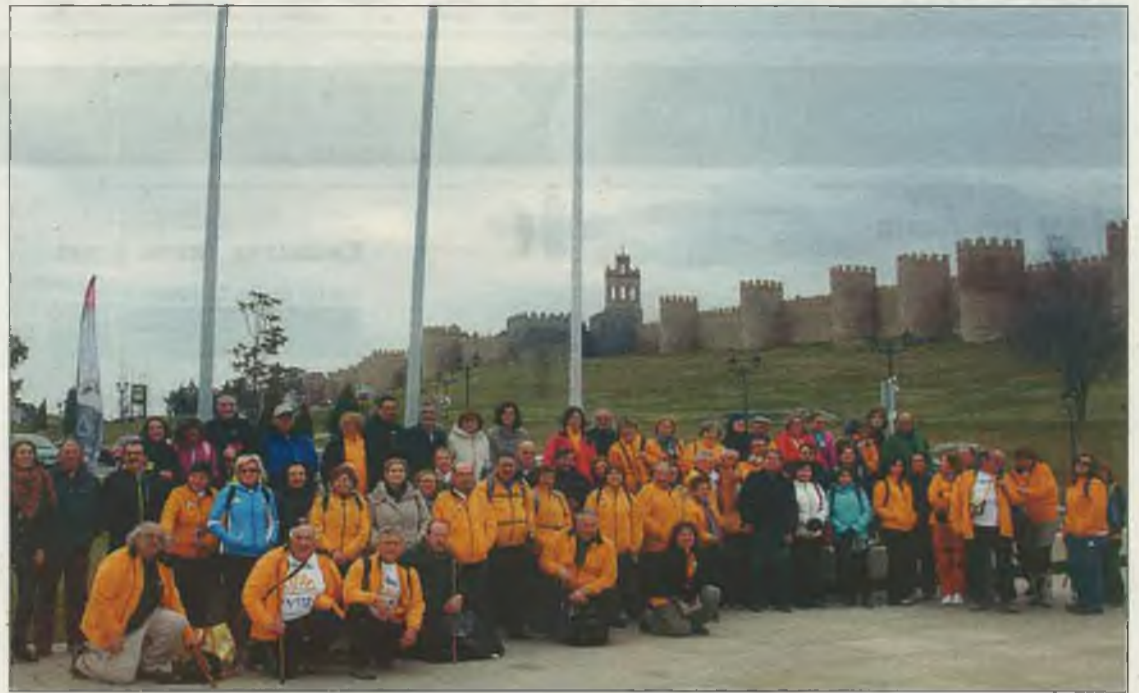
El grupo de peregrinos, en una gran foto de familia tras la marcha.

De hecho, ella fue la principal protagonista en la comida de hermandad celebrada en el Lienzo Norte de Ávila una vez concluida la etapa. A ella se unieron unos 20 miembros más de la asociación y el mismísimo Santiago, patrón de España, que representado con simpatía por uno de los