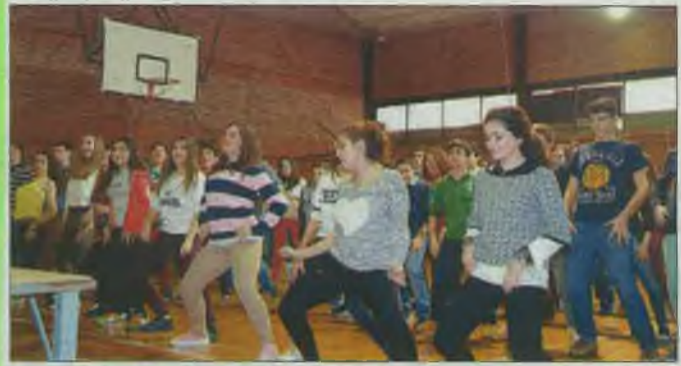
Alumnos del Colegio Diocesano en la 'Semana de las Artes y el Deporte'.