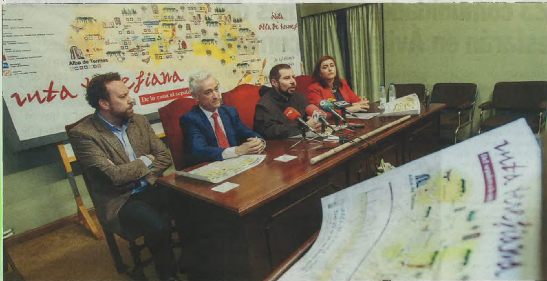
Representantes de la Diputación, del Ayuntamiento de Ávila, de la Comisión del V Centenario y de la Asociación Turismo La Moraña, ayer, junto a alcaldes de varios de los pueblos por los que discurre la ruta.

V CENTENARIO SANTA TERESA DE ÁVILA | MÁS ALLÁ DE LA CAPITAL ABULENSE