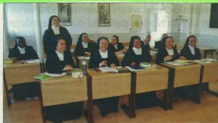
Carmelitas que participan en la formación del Cites.

Por otra parte, los estudiantes de Máster de la Universidad de la Mística viajaron a Salamanca, conociendo lugares relacionados con Santa Teresa y San Juan de la Cruz.