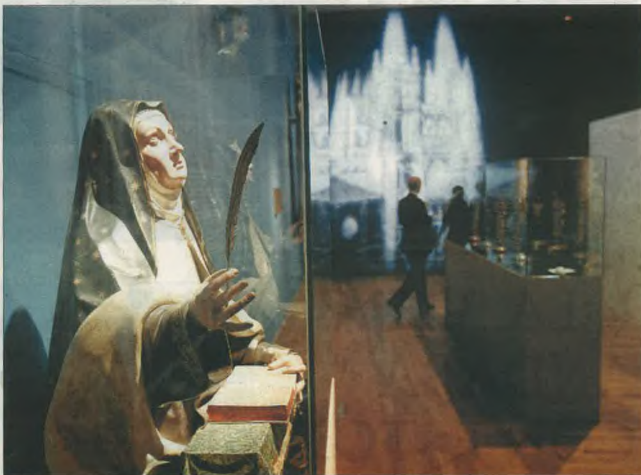
La exposición describe la vida y la obra de Teresa a través de diferentes representaciones artísticas y de los libros de la Santa. / JUAN LÁZARO

muestra la inmensa riqueza de su vida, su labor como fundadora y, sobre todo, la originalidad y belleza de su obra literaria. Abrió sus puertas mañana jueves al público, y podrá visitarse de lunes a viernes de 9.00 a 21.00 horas, y los sábados de 9.00 a 14.00 horas, en la Sala Recoletos de la Biblioteca Nacional de España.