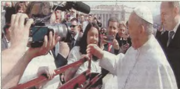
Diferentes momentos de la audiencia y de los peregrinos de 'Camino de luz'.