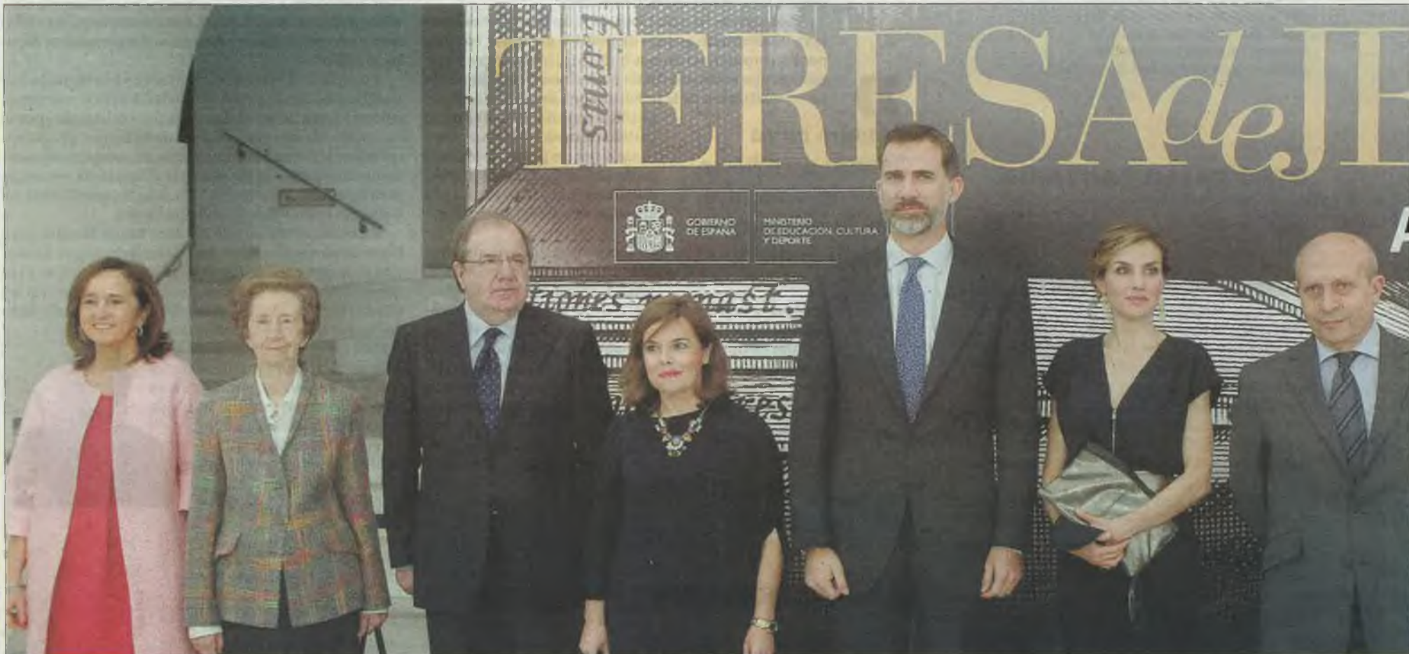
Foto de familia de los Reyes de España y sus acompañantes en la protocolaria comparecencia ante los redactores gráficos y cámaras.

STJ 500 | V CENTENARIO SANTA TERESA DE ÁVILA | PROGRAMACIÓN CULTURAL DE ÁMBITO NACIONAL