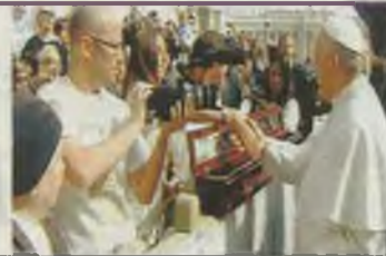
El bastón de Santa Teresa fue protagonista en la audiencia

El Papa Francisco recibe en el Vaticano a los peregrinos de 'Camino de luz'. PÁGINA 8