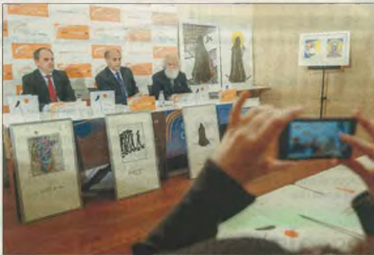
Un momento de la rueda de prensa.

El regidor abulense, que en todo momento se mostró como gran amigo y admirador de la obra del pintor abulense, al que calificó de «extraordinario» y sobre el que dijo que «no hay artistas que mejor manejen la paleta de color como Díaz Castilla». Además indicó que en su obra este artista transmite «amor y