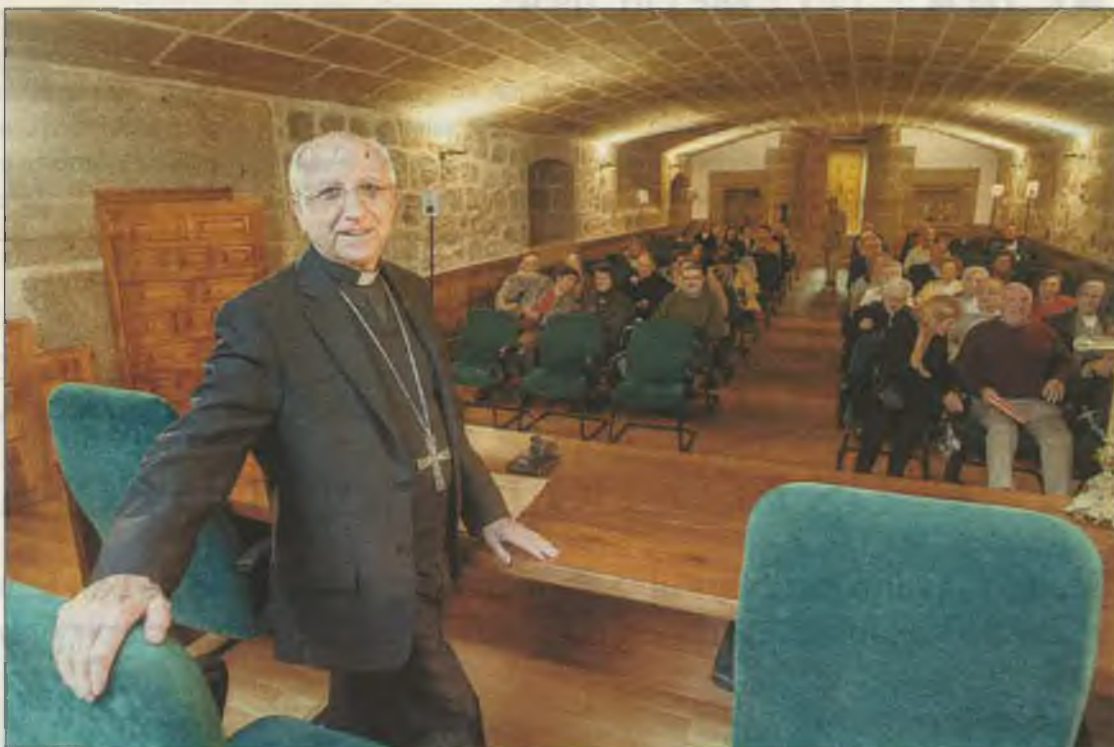
El obispo, momentos antes de la presentación de una carta pastoral del V Centenario.

Todo ello sin olvidar que estamos en una «misión», en la de salir a los demás y «llevar el gozo de nuestra existencia». En este punto recordó cómo el Papa Francisco coincide con la espiritualidad de Santa Teresa cuando pide salir a transmitir la fe, ser una «Iglesia en salida» y «no encerrarnos en no-