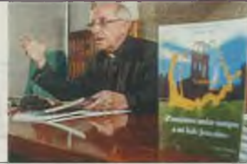
Un momento de la presentación de la carta pastoral.

El obispo invita «a acercarse al corazón de Santa Teresa» en su carta pastoral. PÁGINA 8