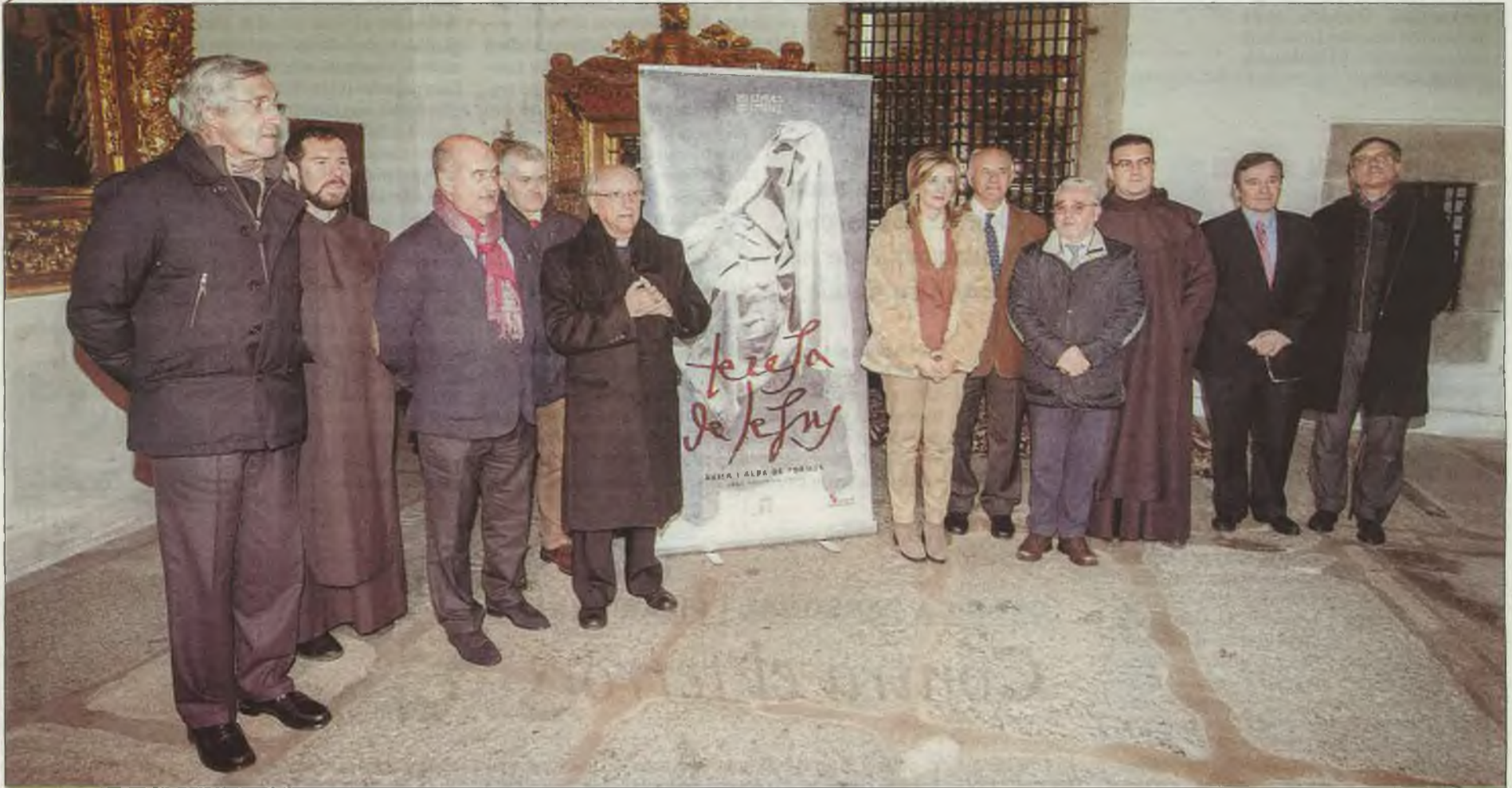
Autoridades presentes en la presentación posan junto al cartel de la exposición de Las Edades del Hombre.

V CENTENARIO SANTA TERESA DE ÁVILA | PRESENTACIÓN DE LA EXPOSICIÓN DE LAS EDADES DEL HOMBRE