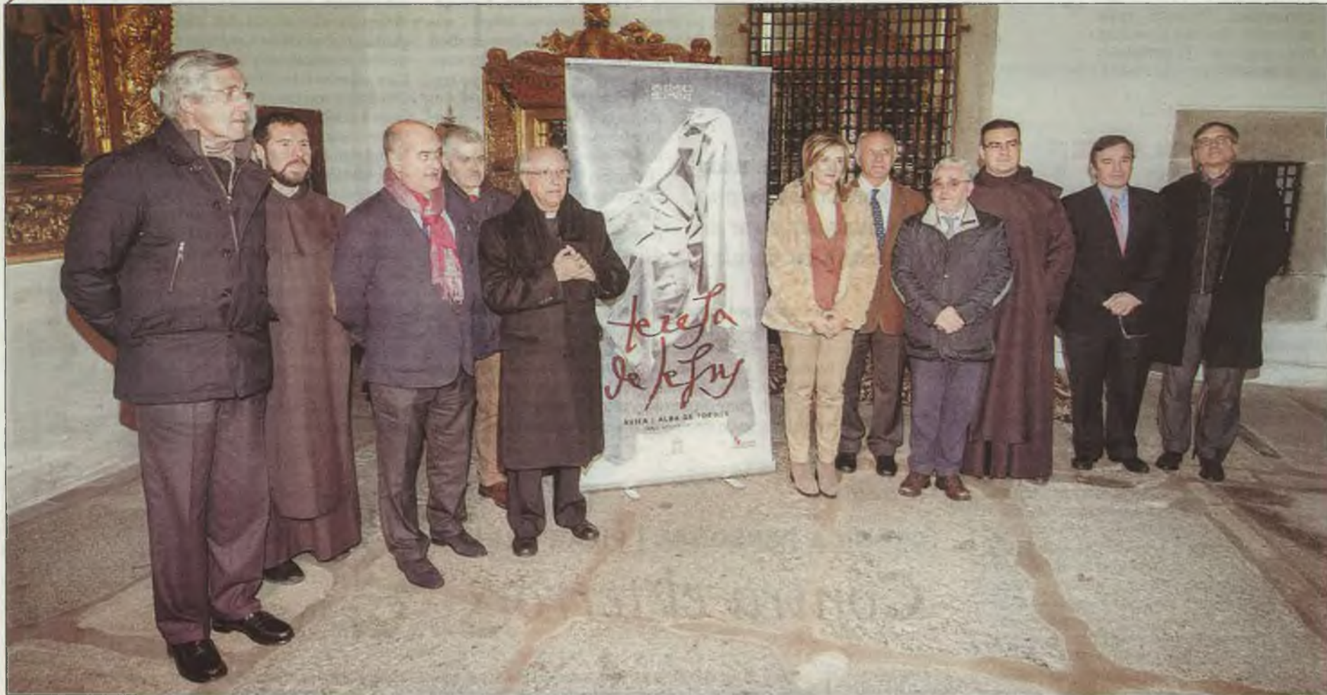
Autoridades presentes en la presentación posan junto al cartel de la exposición de Las Edades del Hombre.

V CENTENARIO SANTA TERESA DE ÁVILA | PRESENTACIÓN DE LA EXPOSICIÓN DE LAS EDADES DEL HOMBRE