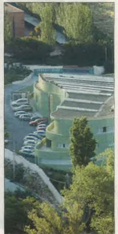
Universidad de la Mística. / p.c.

El encuentro terminará con una nueva oración y meditación.