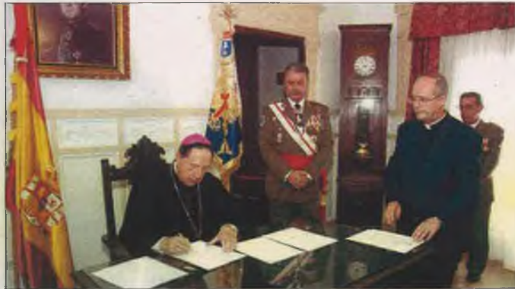
La firma del decreto se celebró en Ávila.

De esta forma, ahora se cuenta con una condecoración especial que sirve para conmemorar los cien años que se cumplen desde que Santa Teresa recibió el nombramiento de patrona de los intendentes.