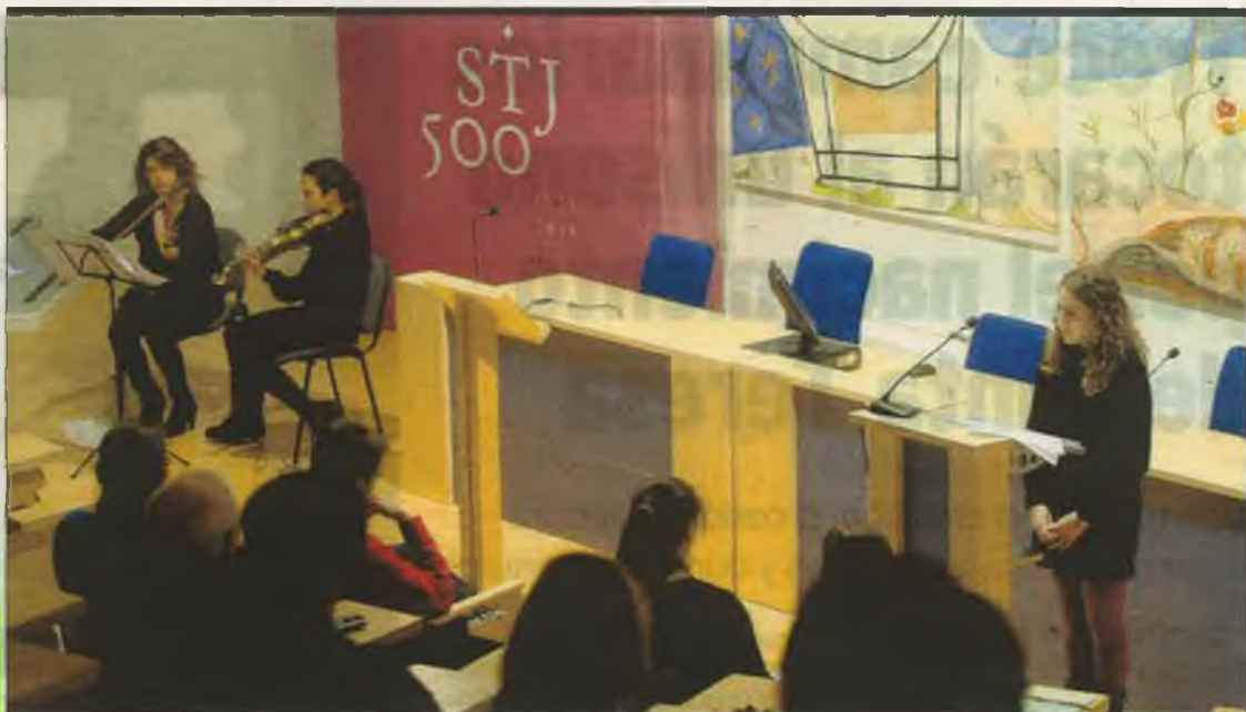
Lectura de textos de Teresa. Este jueves, 27 de marzo, a partir de las 20,00 horas actores de Nueva Escena han realizado una emotiva lectura de varios textos de Santa Teresa de Jesús, acompañados por música en directo. El acto ha tenido lugar en el Cites, donde se han representado de esta manera siete momentos de La Santa, siete retablos de su vida. El acto estaba organizado por el Ayuntamiento y el Cites.

Teresa es Ávila y sus ritmos humanos, religiosos, espirituales y místicos, y Ávila es Teresa en su Castillo Interior y sus moradas intangibles del espíritu. Ella emprendió su vuelo por el mundo pero su sueño de vivir y de morir siempre fue en su San José de Ávila.