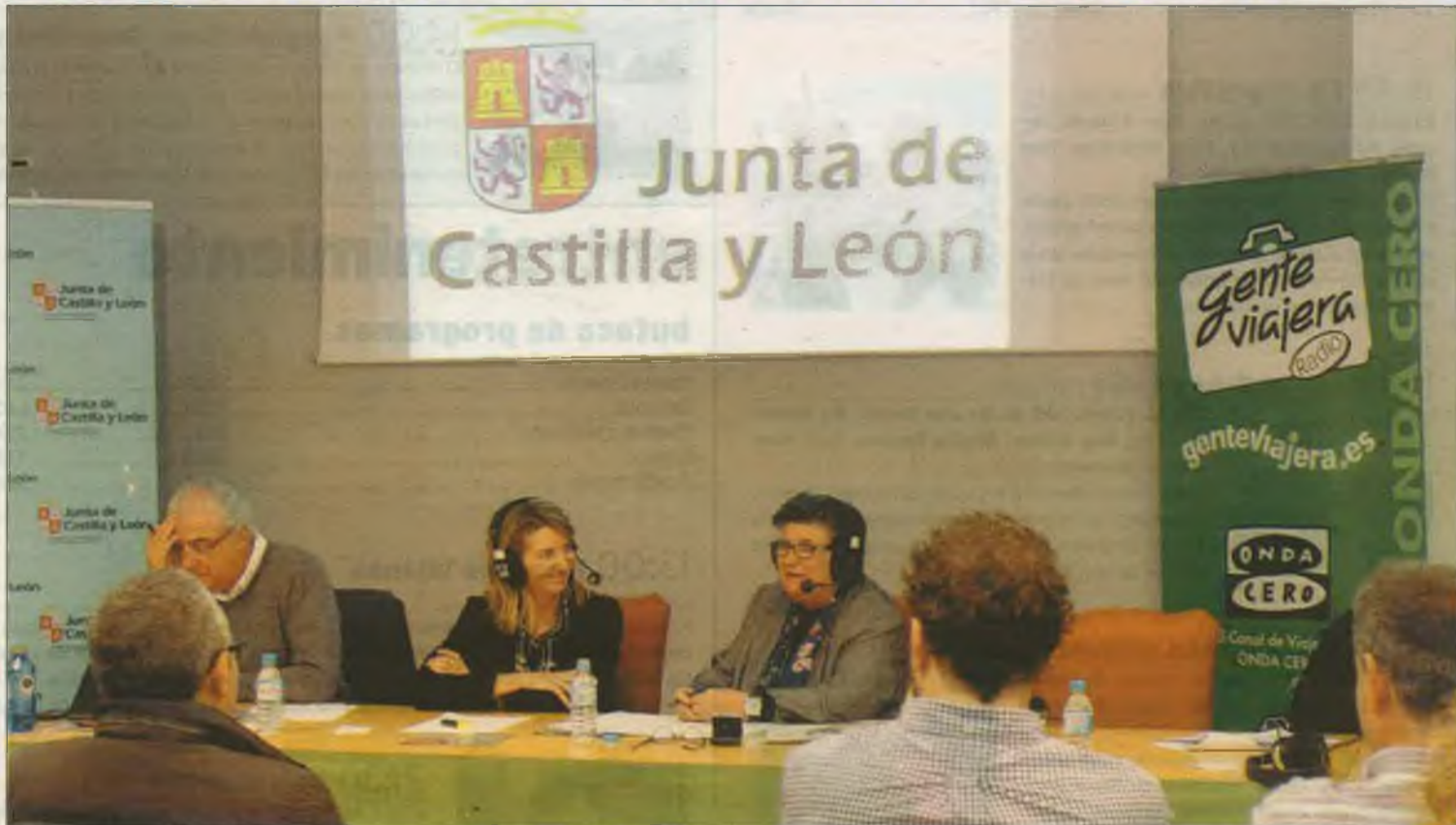
Un momento de la emisión del programa de Onda Cero 'Gente Viajera' en la Biblioteca Pública de Ávila.