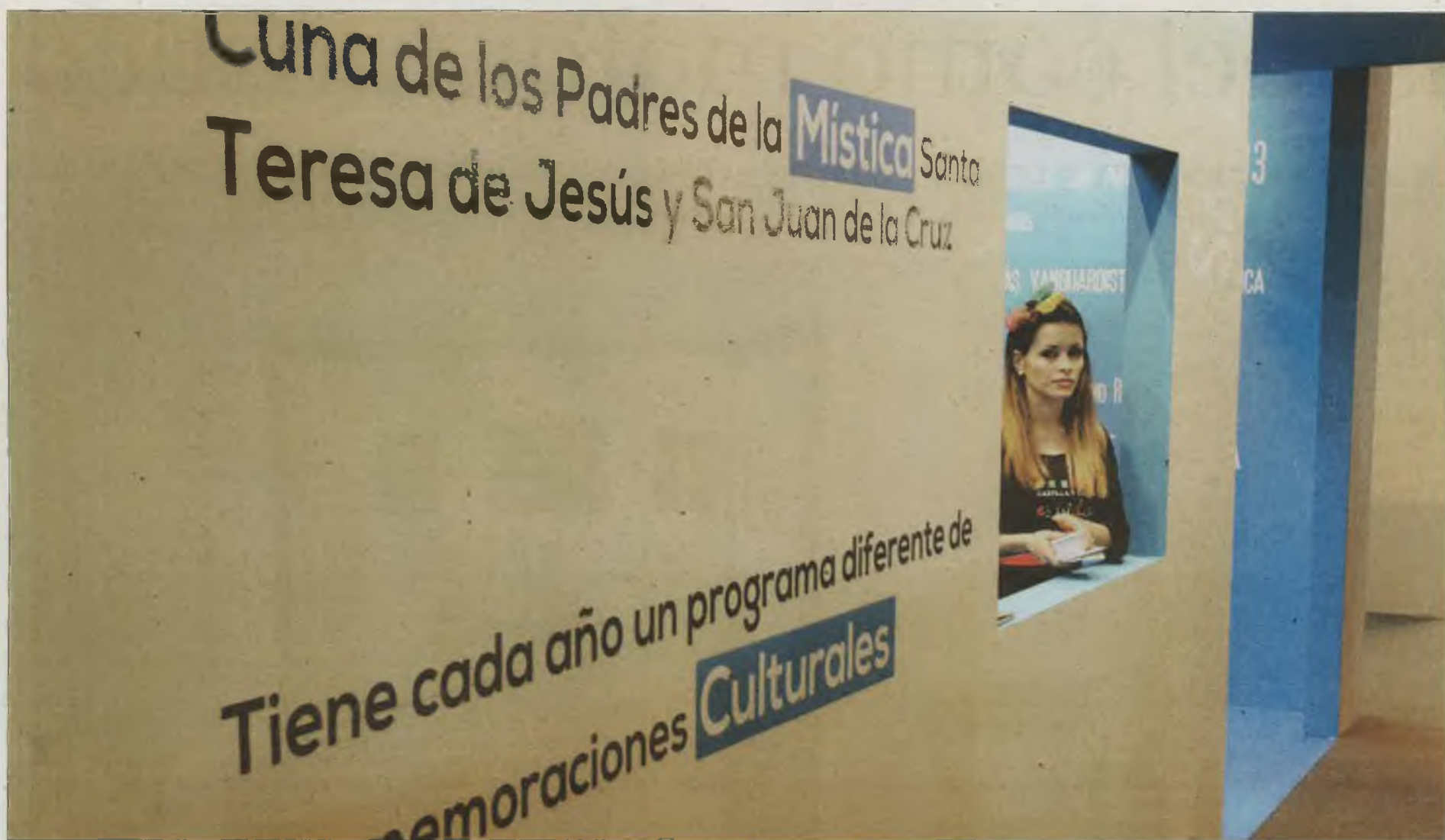
Expositor de Castilla y León en la pasada edición de Fitur, celebrada en 2013, donde precisamente hace referencia a los padres de la mística, los abulenses Teresa de Jesús y San Juan de la Cruz.