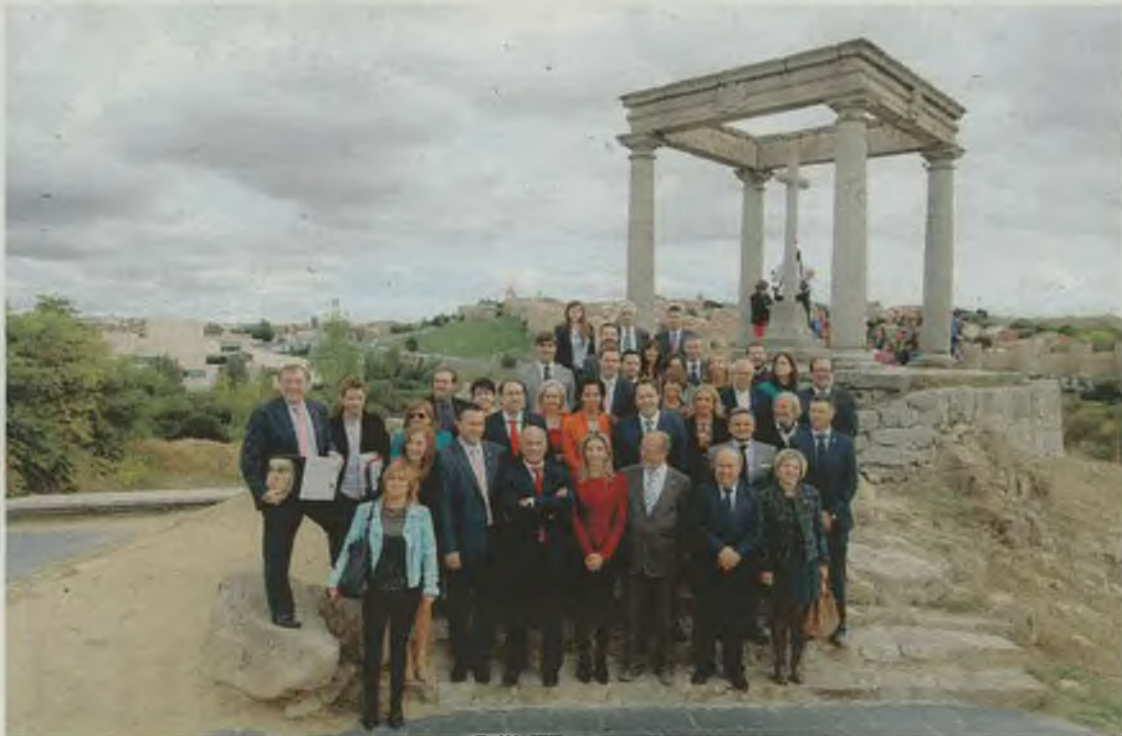
PRIMERA CITA. LOS REPRESENTANTES DE LAS CIUDADES TERESIANAS SE REUNIERON EN ÁVILA EN OCTUBRE.

Además la ruta también se adecua, según sus promotores, a la manera de hacer turismo del