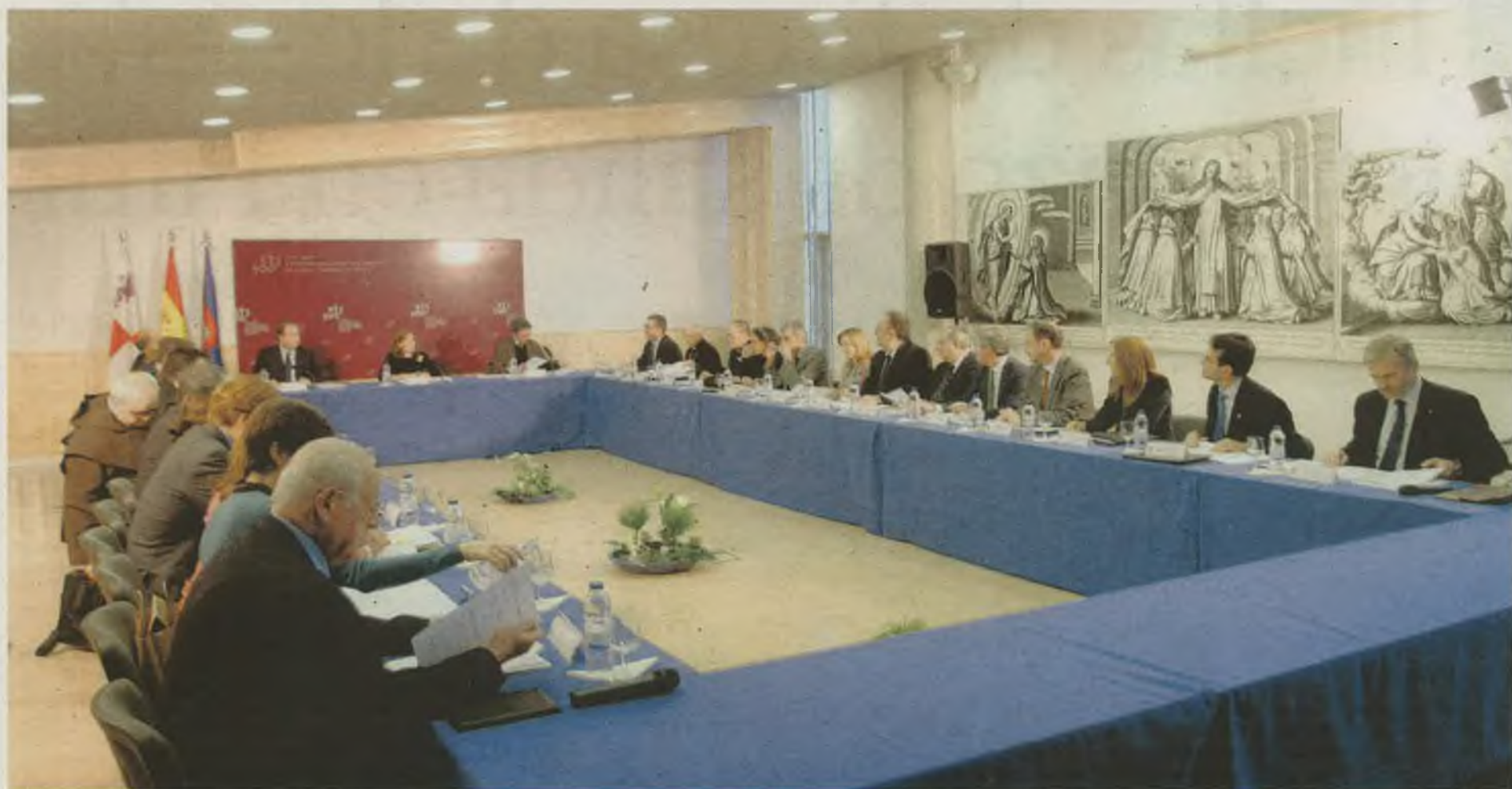
PRIMER ENCUENTRO. LA COMISIÓN NACIONAL DEL V CENTENARIO SE CONSTITUYÓ EL 17 DE DICIEMBRE EN EL CITES. / ANTONIO BARTOLOMÉ