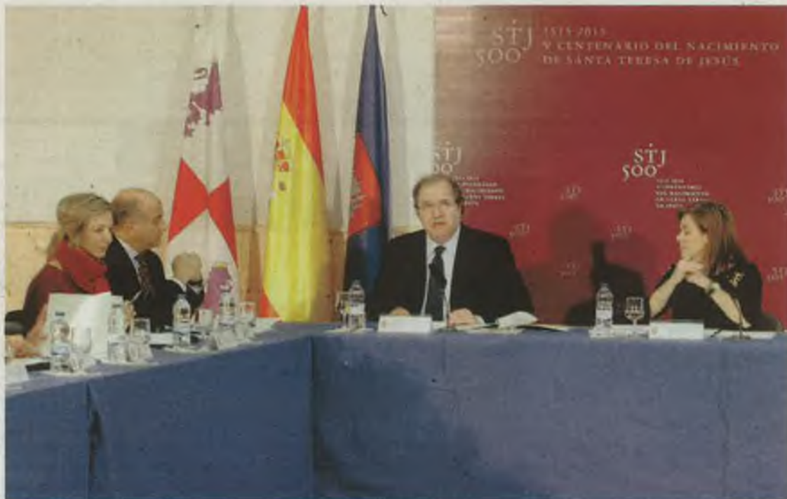
REPRESENTANTES. ENTRE LOS MIEMBROS DE LA COMISIÓN ESTÁ EL ALCALDE DE ÁVILA Y LA CONSEJERA DE CULTURA (EN LA IMAGEN A LA IZQUIERDA), ASÍ COMO EL OBISPO DE ÁVILA O ÁNGEL ACEBES.

Además, los visitantes se multiplicarán por las diferentes peregrinaciones y encuentros organizados por el Centenario. Se organiza-