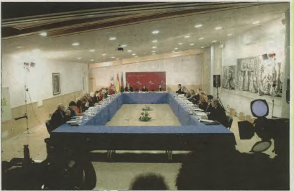
Constitución de la Comisión Nacional, donde se decidieron los representantes de la Ejecutiva.