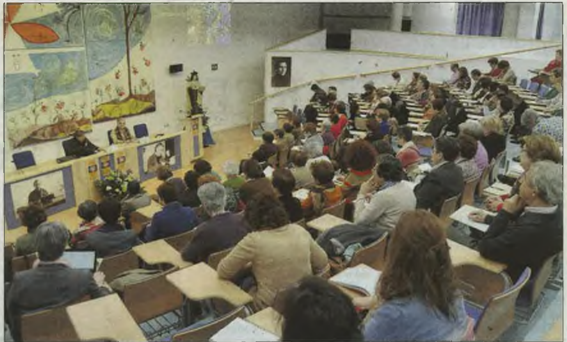
Un momento de la celebración del curso en el Cites.

La tercera exposición, 'Urgidos por un carisma a orar en el