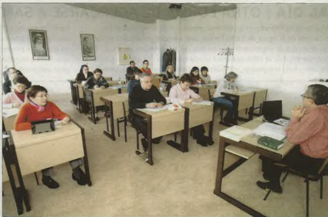
Asistentes al curso del Cites.

Uno de estos cursos se celebró este mismo fin de semana con el director del Cites, Francisco Javier