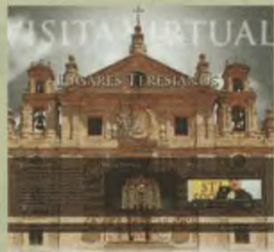
Visita virtual al convento en Ávila

A través de la web www.lugares-teresianos.com se puede realizar una visita virtual al convento de la santa y a su capilla natal en Ávila. Lo mismo se va a realizar con Alba de Tormes.