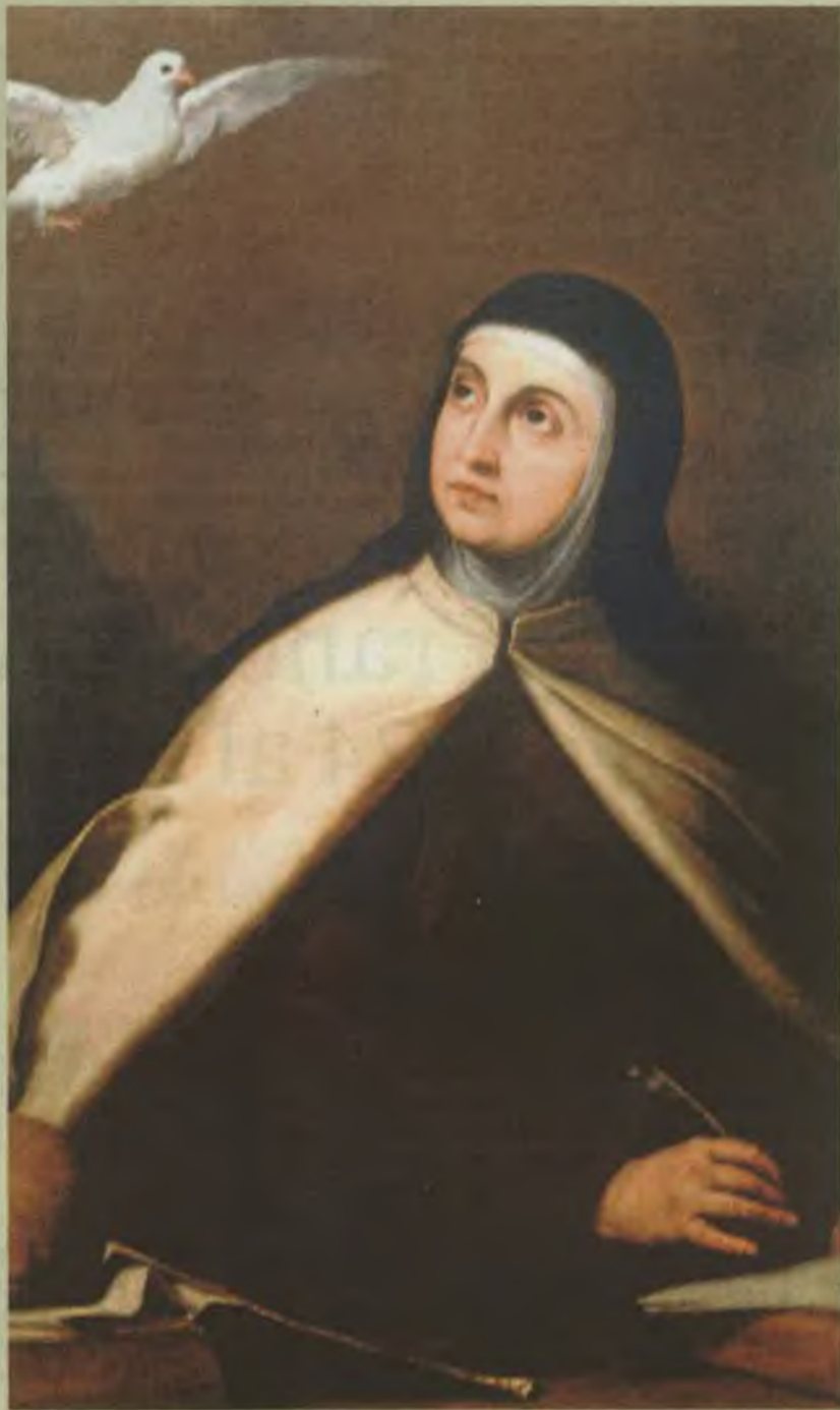
Santa Teresa de Jesús en un óleo sobre lienzo de José de Ribera

Gran parte de su obra transmite su experiencia espiritual