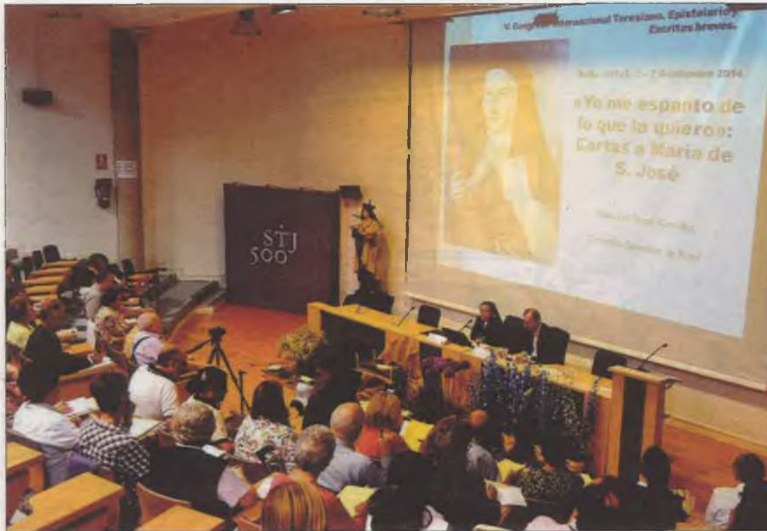
Imagen del Cites en la jornada de este miércoles, dedicada a 'El amor vivido en la Relación'.