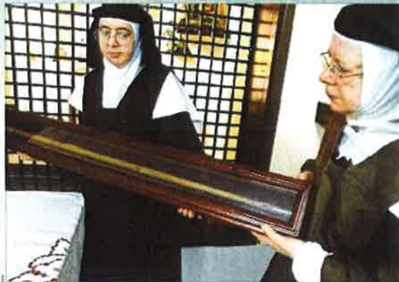
Dos hermanas carmelitas sostienen una caja con un busto de Santa Teresa de Jesús, en una Iglesia de Asunción (Paraguay). Este objeto preservará los cinco contenidos hasta el 20 de marzo del 2025.