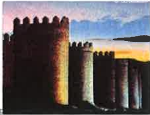
La maralla de Avila recibe cada año a millones de peregrinos que buscan conocer la historia de esta santa. En 1515, y más tarde sus milagros.

—¿Cuál será a su juicio su obra cumbre? —"Las moradas", un magro trabajo que está escrito en un etapa de madurez, en 1577. Es un libro muy completo y denso, porque sus expectativas son mucho más consolidadas y profundas. Revela experiencias interiores, como la insubordinación trinitaria o el éxtasis con el Resucitado pero, sobre todo, es una vida interior de comunión con Dios. La com-