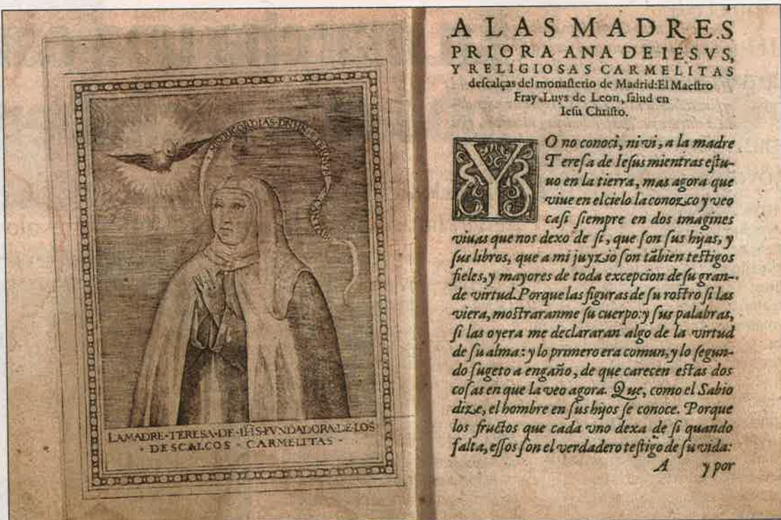
Libro en el que Fray Luis de León elogia a «la madre Teresa de JHS, fvdadora de los descalcos carmelitas».