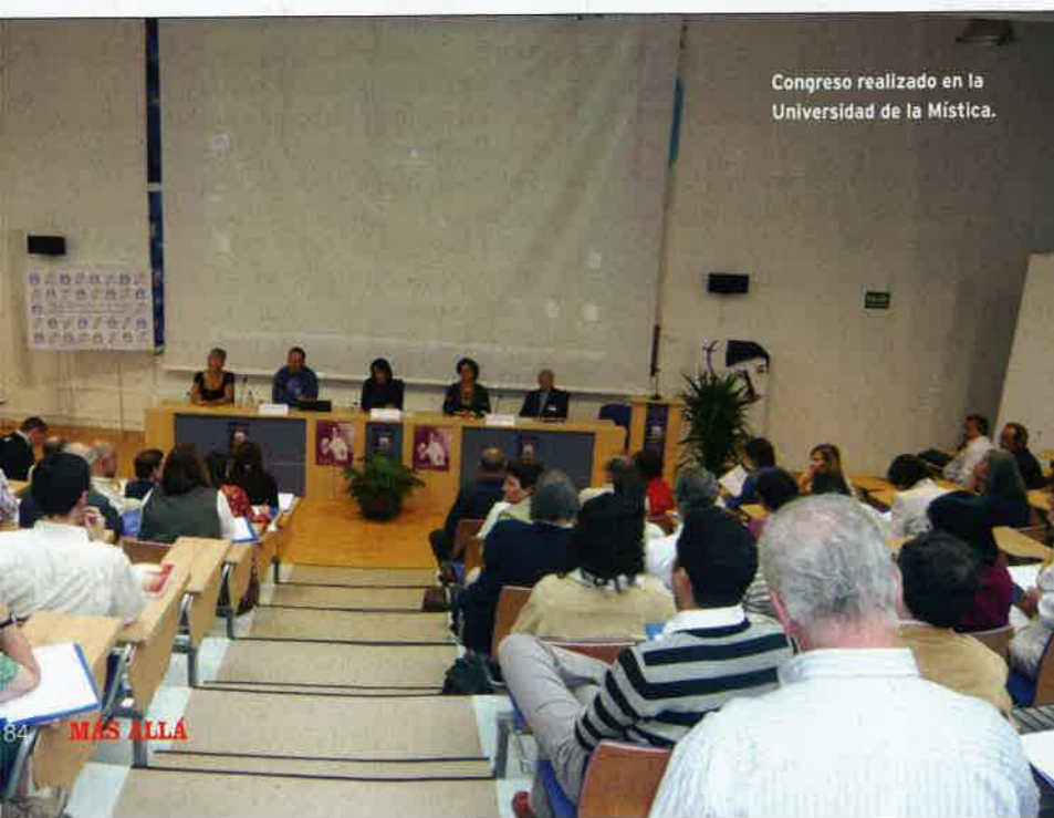
Congreso realizado en la Universidad de la Mística.

evitar ser arrestada por la Gestapo y deportada al campo de exterminio nazi de Auschwitz, muriendo gaseada a los 51 años de edad. El 11 de octubre de 1998 fue canonizada por el papa Juan Pablo II . Un año más tarde fue declarada copatrona de Europa. Las Obras completas de Edith Stein están publicadas en castellano en cinco grandes volúmenes gracias a tres editoriales carmelitanas: Monte Carmelo (Burgos), El Carmen (Vitoria) y EDE (Madrid).