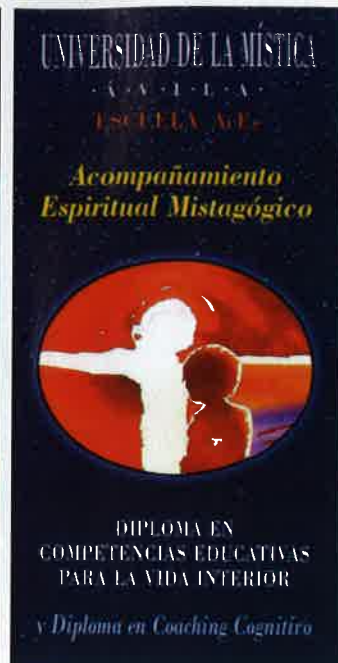
Arriba, opúsculos sobre algunas de las actividades que realiza la Universidad de la Mística.

→ mente en lo académico. Además, el profesorado es muy amplio y diverso, procedente de distintos campos de especialización y de diversas universidades y nacionalidades. Todos ellos son especialistas en sus campos concretos y en relación con el tema de la mística.