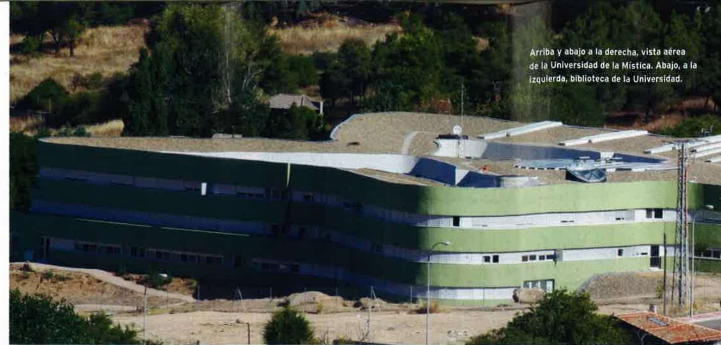
Arriba y abajo a la derecha, vista aérea de la Universidad de la Mística. Abajo, a la izquierda, biblioteca de la Universidad.

–Si tenemos en cuenta algunas definiciones sobre lo que es la mística, nos encontramos con que una parte de su propio proceso es una búsqueda interior. Es interesante la definición que hace el monje benedictino Willigis Jäger acerca de lo que es la mística, pues para él “no es otra cosa que la búsqueda de nuestra identidad verdadera”. Si esto es así, podemos