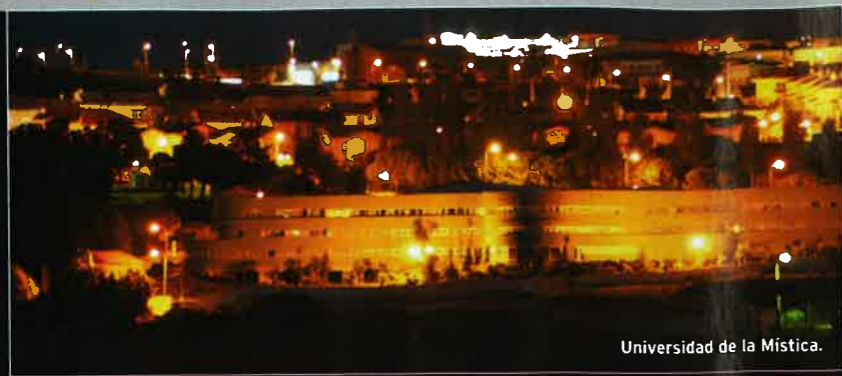
Universidad de la Mística.