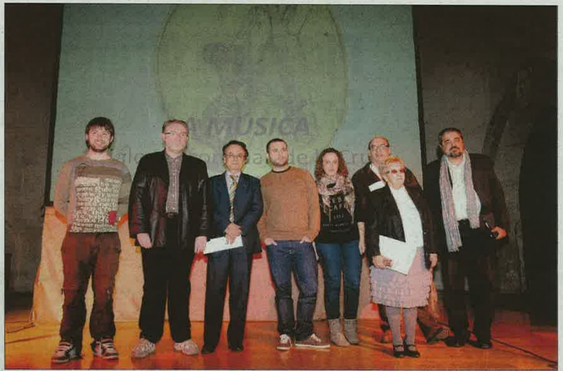
Foto de familia de los poetas que intervinieron en el homenaje.

DIÁLOGOS. A partir de ese momento comenzaron los diálogos con Juan de la Cruz, lances verbales repartidos en una suerte de