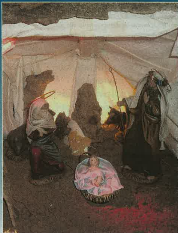
Que el niño Dios que va a nacer nos ilumine a todos.