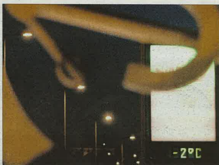
Ayer los termómetros se mantuvieron bajo cero en la capital. / DAVID CASTRO

1. El belén de Caja de Ávila fue uno de los más concurridos. 2. También hubo gente que se acercó al Torreón de los Guzmanes. 3. En la Universidad de la Mística se puede hacer un recorrido por los belenes de todo el mundo. 4. El belén de la residencia Santa Teresa de Jesús Jornet es uno de los que más tradición tienen entre los abulenses. 5. Uno de los belenes expuestos en por el Centro Internacional Teresiano Sanjuanista (Cites). 6. Nacimiento del Mercado Chico, instalado como cada año por el Ayuntamiento. / DAVID CASTRO