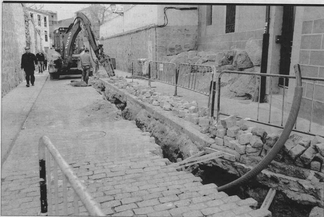
Siguen las obras en la calle Doctor Luis Lobera. Hasta el día de hoy continúan las obras en las calle Doctor Luis Lobera para canalizar el gas natural, razón por la que el tráfico en la misma está cortado y desviado desde la plaza de Nalvillos por la calle Santa Catalina y, por la travesía de Santa Catalina, permitir el acceso a la calle Eduardo Marquina. Las obras está previsto que terminen hoy.

cios». La Junta de Personal destaca la capacitación del profesorado para «atender las diferencias, resolver las dificultades y proporcionar a los alumnos una formación de calidad». Además, destaca los servicios tales como comedores, transporte, programa madrugadores, programa centros abiertos, actividades extraescolares, así como características de una enseñanza «democrática y participativa, integradora, crítica, coeducadora, científica y formadora en valores». Para la Junta de Personal Docente no Universitario de Ávila, «la Educación Pública es un pilar fundamental para el desarrollo social, cultural y cívico de la sociedad y de todas y cada una de las personas que la integran».