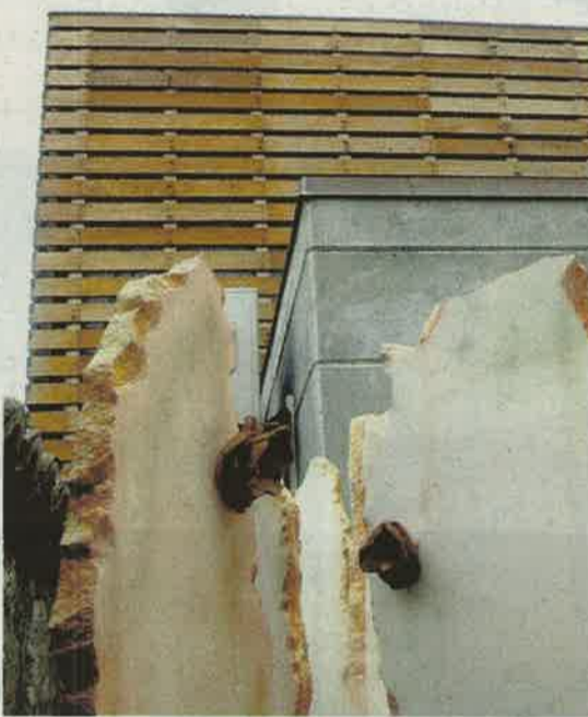
EL CIEM ES UN REFERENTE DE LA MÍSTICA MUNDIAL. / A. B.