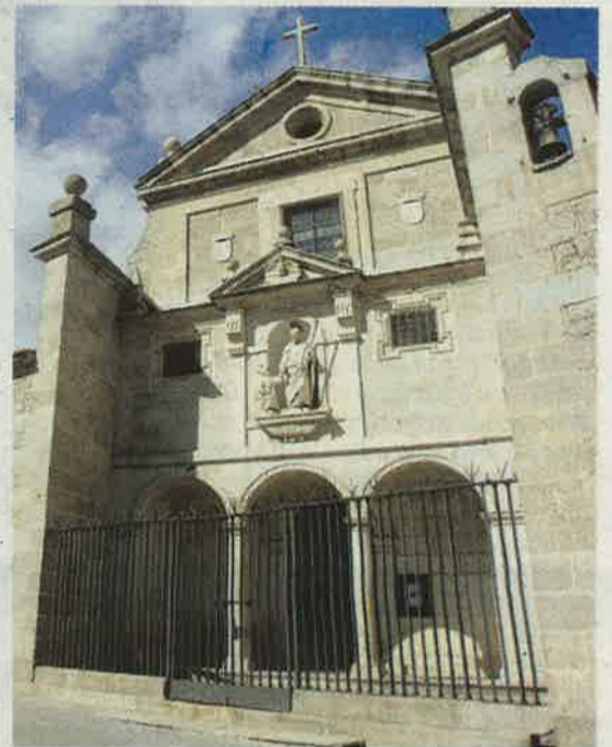
FACHADA DEL CONVENTO DE SAN JOSÉ.