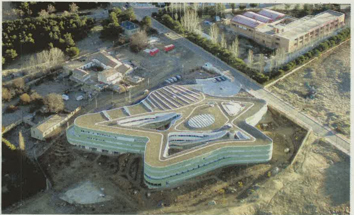
VISTA AÉREA DEL EDIFICIO DEL CITES, CON SU PECULIAR FORMA DE ESTRELLA.

EL CITES. El recorrido místico no puede concluir sin visitar el Centro Internacional Teresiano-Sanjuanista (CITES), fundado en Ávila en 1986, aunque desde hace poco más de dos años la orden de carmelitas descalzas inauguró un nuevo edificio lleno de simbología, un jardín interior en el que se desarrolla la vida plena de espiritualidad y con una completa e intensa programación académica que bebe de las fuentes de Santa Teresa y San Juan.