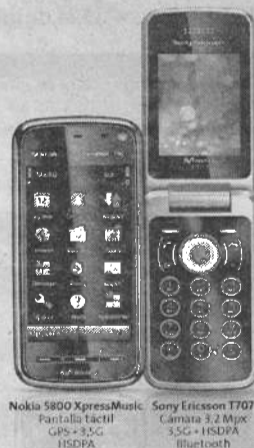
Nokia 5800 XpressMusic: Pantalla táctil, GPS, 3.5G, HSDPA. Sony Ericsson T707: Cámara 3.2 Mpx, 3.5G, HSDPA, Bluetooth.

Y HABLA GRATIS LOS FINES DE SEMANA CON CUALQUIER OPERADOR PARA SIEMPRE POR 9€/MES**