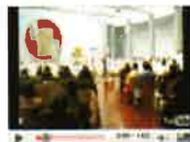
Eucaristía de inauguración de la Universidad de la Mística