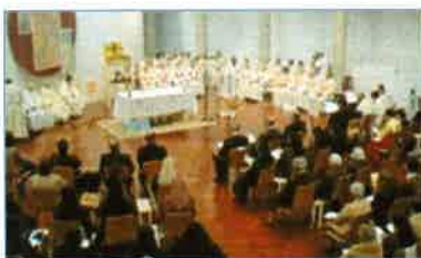
Celebración eucarística en la capilla de la Universidad de la Mística