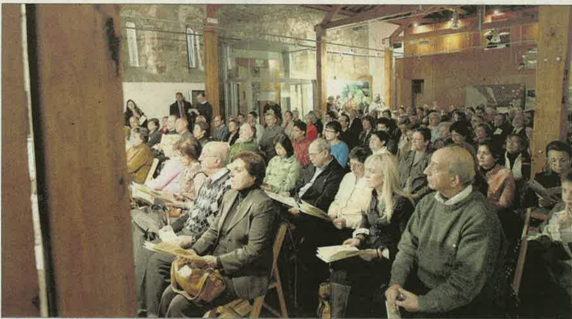
Un momento del encuentro poético, musical y visual en torno a San Juan de la Cruz.