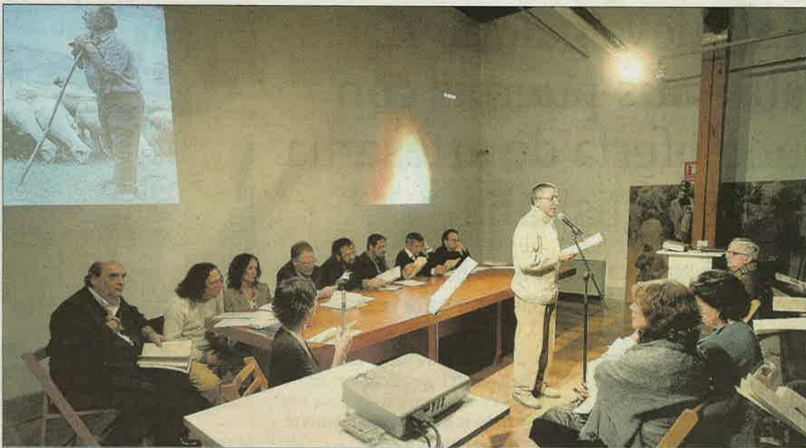
El aforo del Episcopio se quedó pequeño ante la afluencia de público.