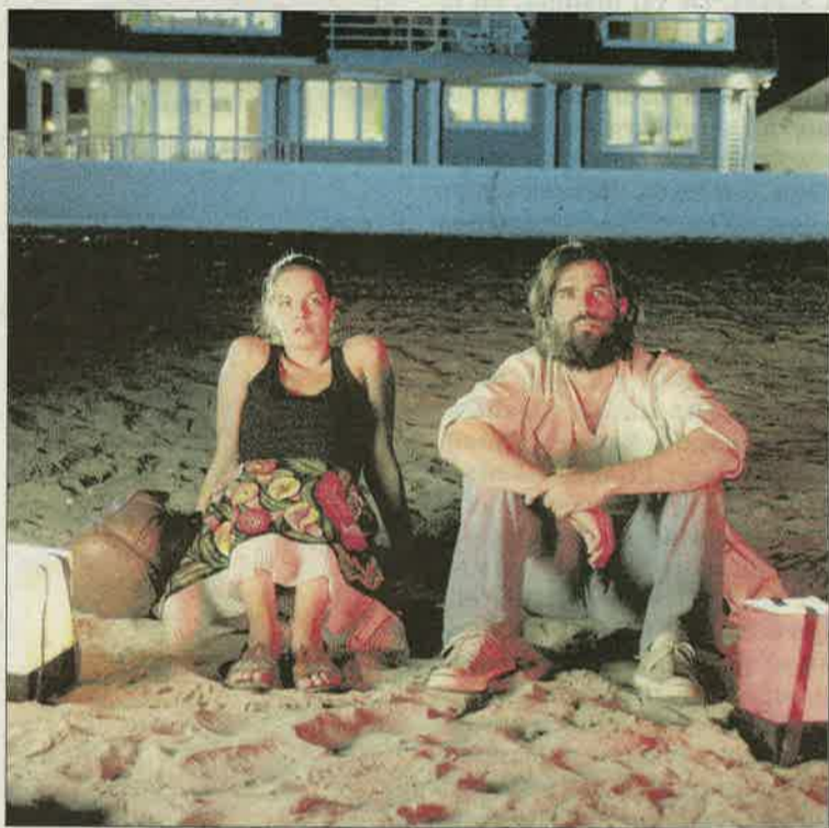
Fotograma de 'Bella', cuya proyección en Ávila ha promovido la UCAV.