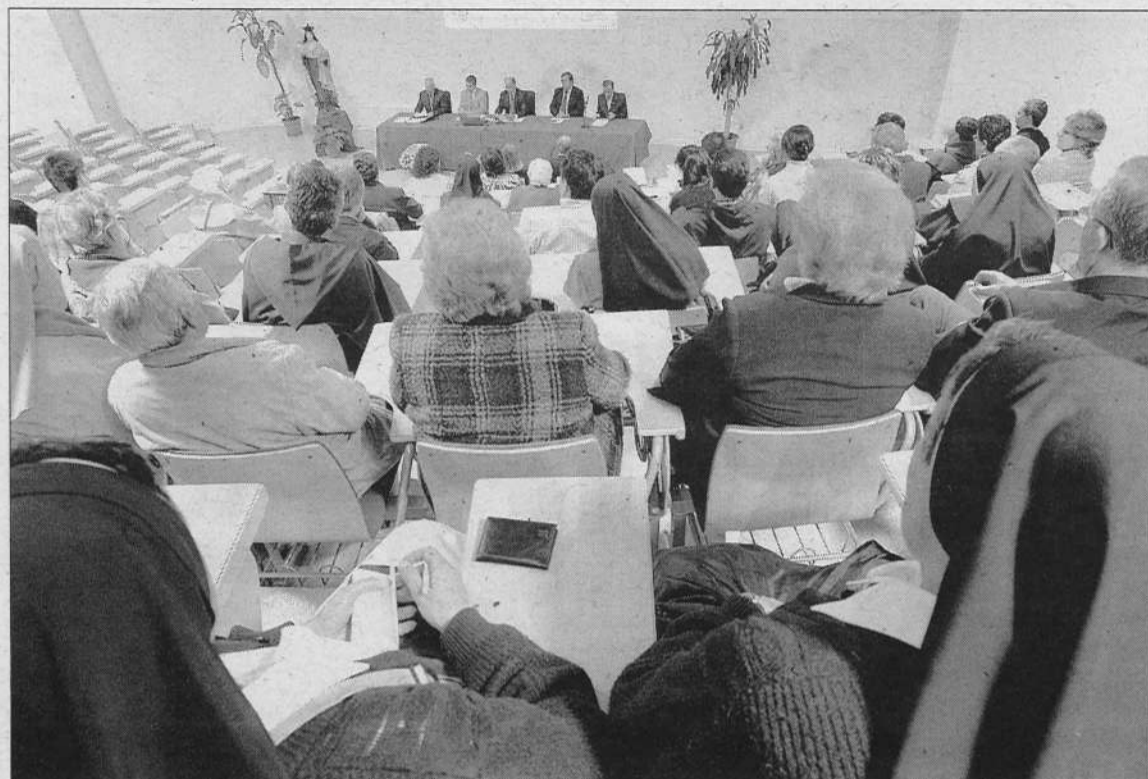
Asistentes a la inauguración del curso del Cites.