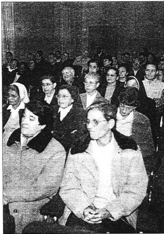
Acto de inauguración del curso del Centro Teresiano Sanjuanista.

Por esta razón, la Comisión de Gobierno municipal acordó enviar un escrito a la Caja de Ahorros de Ávila para que se produzca la reversión de aquel terreno que se cedió con la condición de edificar la citada biblioteca. En este terreno, según el Ayuntamiento, se podría dar cobertura a la petición efectuada por el Centro Internacional Teresiano Sanjuanista de Ávila.